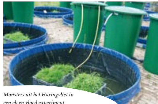
Monsters uit het Haringvliet in een eb en vloed experiment