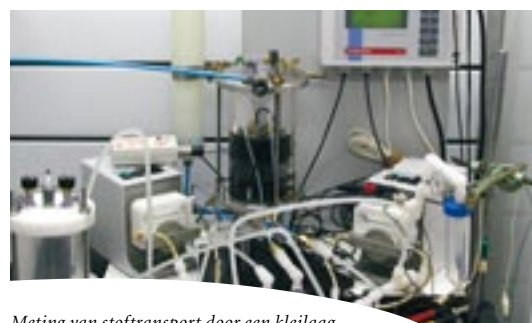
Meting van stoftransport door een kleilaag

een dichte kleilaag, bijvoorbeeld de afdichting van een slibdepot, kunnen ongewild water- en stoftransport gaan optreden door de kleilaag onder invloed van opgewekte chemische en elektrische potentiaalverschillen. Daardoor kan het depot gaan lekken. In dit onderzoek is experimenteel onderzoek gedaan: in het laboratorium met dunne kleiplakken in een zogeheten 'permeameter' en in het veld in ondiepe kleilagen en in zeer diepe, compacte kleipakketten ('Boomse klei') met behulp van piëzometers. Tevens is door bewerking van bestaande gegevens uit de literatuur nagegaan of door deze mechanismen inderdaad verontreinigingen uit een slibdepot zouden kunnen weglekken. Project 835.80.003, Chemically and electrically coupled transport in clayey soils and sediments. Projectleiders: Dr. J.P.G. Loch en Dr. R.J. Schotting, UU - Faculteit Geowetenschappen en Dr. H. Kooi, VU - Faculteit Aardwetenschappen. Looptijd: 2001 - 2005. Informatie: jpgl@geo.uu.nl .