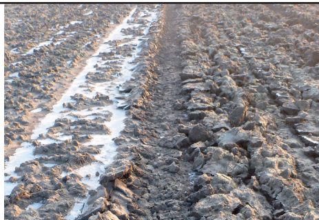
Foto 3| Situatie op 31 januari 2014, links M (NKG zonder woelen) en rechts T (NKG met woelen)

[Zomertarwe (biologisch)] Na de witte kool van 2013 is er een mooie structuur achtergebleven. Het perceel is oppervlakkig bewerkt om de alweer uitlopende koolstronken los te werken. Voor de bodemstructuur had dit niet gehoeven. De stronken begonnen uit te lopen en zouden in de weg zitten bij het tarwe zaaien. Bij het onkruid-eggen hebben de losse stronken wel voor uitval van planten gezorgd door opstropen en bulldozeren. Na 1,5 jaar grasklaver en vervolgens kool is de bodemstructuur van het perceel in goede conditie. Een goed uitgangspunt voor de peen in 2015. Zorgpunt is het straatgras dat zich door de zachte winter heeft kunnen settelen. Onderzaai van een mengsel van rode/witte/alexandrijnse klaver kan de groei hiervan enigszins onderdrukken.