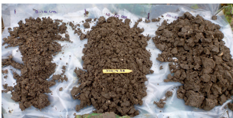
Figuur 1 | structurelementen in drie bodemlagen

De bodems van de verschillende grondbewerkingstypes verschillen in bodemstructuur. De geploegde grond is fijner (hoger aantal kruimels, minder scherpblokkige structuren) terwijl de minimale grondbewerking resulteert in een stevigere grond (minder kruimels, meer scherpblokkige structuren). De tussenvorm bevat zowel veel kruimels als veel scherpblokkige elementen.